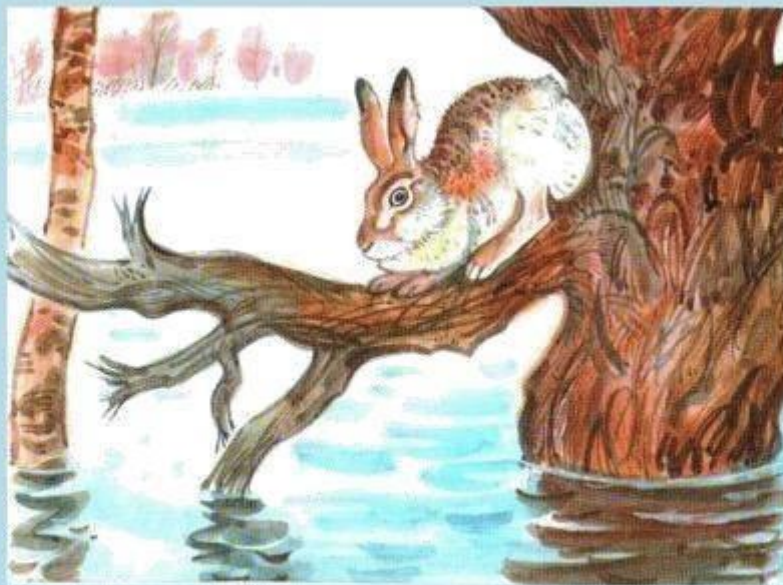
Картина А.Н.Комарова «Наводнение»