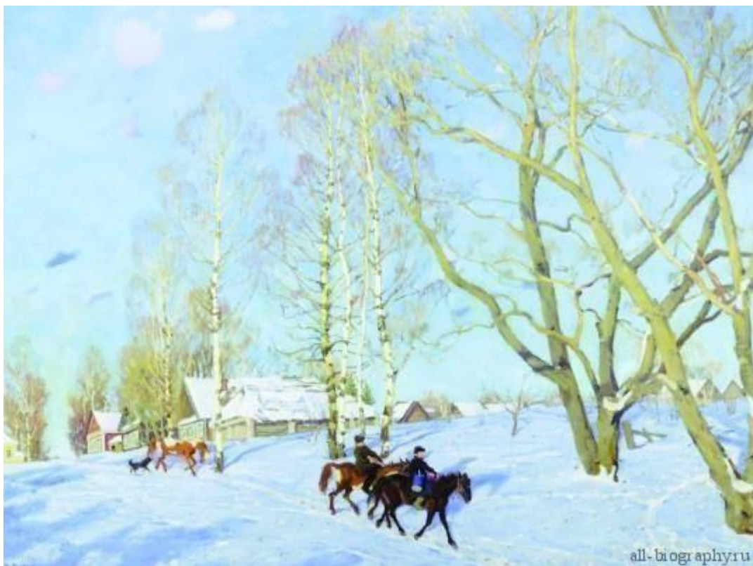
Юон К. Ф. «Мартовское солнце»